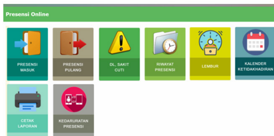
Gambar 2. Tampilan Menu Presensi Online pada Aplikasi SMART ASN