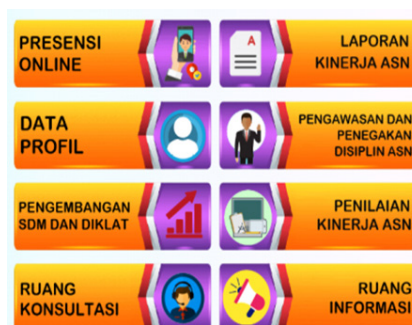
Gambar 1. Tampilan Home pada Aplikasi SMART ASN

Aplikasi aplikasi SMART ASN merupakan alat pencatat kehadiran dengan menggunakan sistem cloud yang terhubung dengan data base secara real time (waktu sebenarnya). Sistem cloud menyimpan data secara otomatis yang kemudian data tersebut dapat diakses di mana saja dan kapan saja selama masih terhubung dengan internet. Aplikasi SMART ASN ini memiliki cukup banyak fitur di dalamnya seperti yang dapat dilihat pada Gambar.1 dan masing-masing fitur memiliki menu tersendiri. Namun pada penelitian ini peneliti hanya memfokuskan penelitian pada laporan presensi (Gambar.2) dan laporan kinerja (Gambar.3) serta pengawasan dan penegakan disiplin ASN (Gambar.4) Kementerian Agama Kabupaten Bungo.