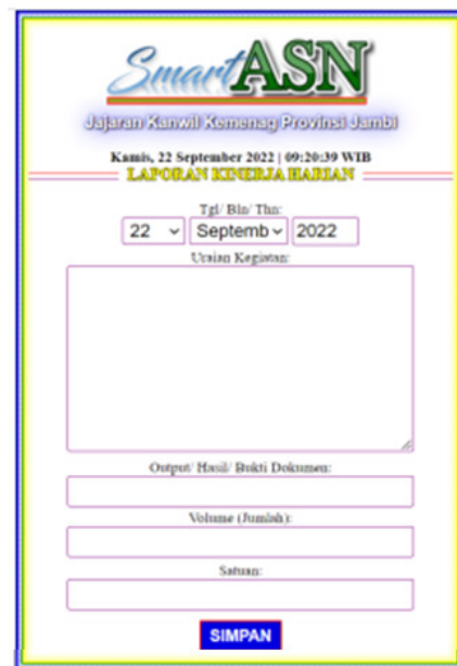
Gambar 3. Tampilan Menu Laporan Kinerja ASN pada Aplikasi SMART ASN